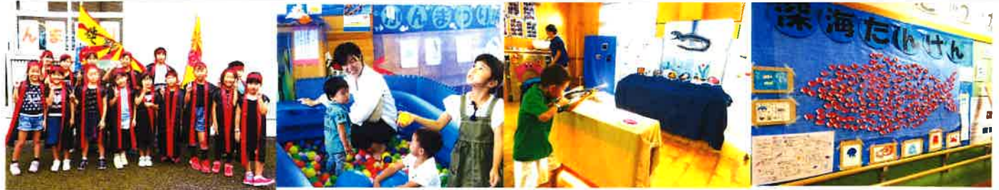
10/5 かんまつり ソーラン、美味しいポテト、深海たんけんと盛りだくさん！ご来館、ありがとうございました。