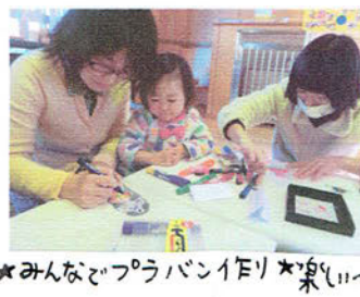
★みんなとPurabon作り★楽しい～