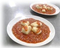
ジャガイモなどを使って 「ニョッキ」を作りました!