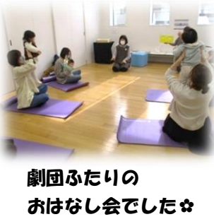
劇団ふたりの おはなし会でした☆