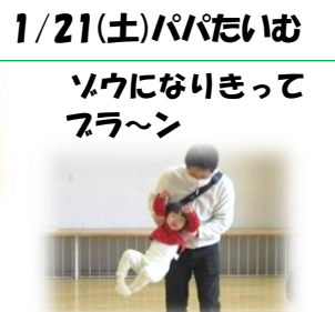
1/21(土)パパたいむ ソウになりきって フラ～ン