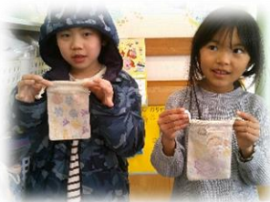
しょうす 上手にできた！