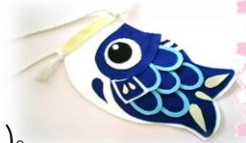
かわいい鯉のぼりのバッグ☆

定員：12組 先着順 時間：10:00～11:00 申込：4月8日(月)～4月27日(土)までに、直接または電話で申し込みください。 参加費：300円（当日集金します）