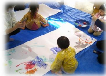
絵の具でお絵描き♪