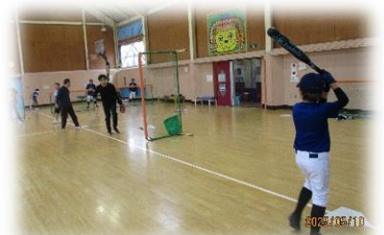
5/10(土)「リアル野球盤」 今回はホールでプレイボール