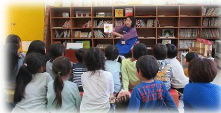
5/9(金)おはなし☆山王さん のお話し会「絵本の時間」